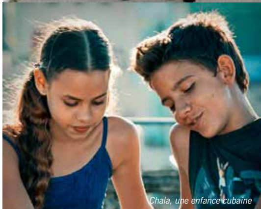
Chala, une enfance cubaine

Direction de la Communication Ville de Montpellier / ZAGRAF / Photos : DR / Février 2016