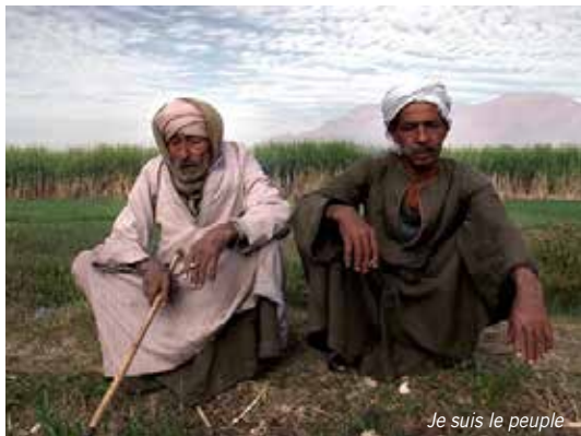
Je suis le peuple