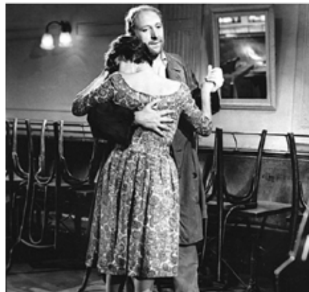
Palme d'Or – Cannes 1961 / Prix Louis Delluc - 1960