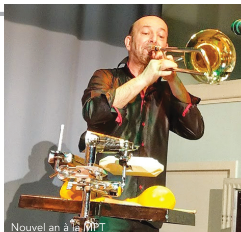
Nouvel an à la MPT

Sur la page "Sortir à Celleneuve" de notre site internet : Les animations proposées dans le quartier tout au long de l'année.