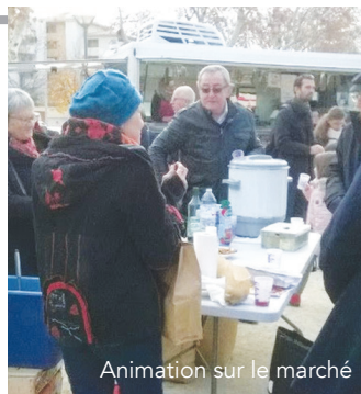
Animation sur le marché