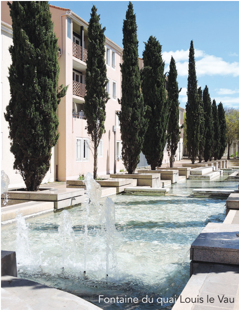
Fontaine du quai Louis le Vau

L ors du plan action quartier de Celleneuve, des aménagements ont été demandés pour la ZAC de La Fontaine. Un groupe de résidents, des élus et techniciens ont parcouru le 14 février dernier la place Mansart, le quai Louis Le Vau, le square André Carles et la rue François d'Orbay pour une première visite ainsi que pour recueillir des ressentis et des premières idées.