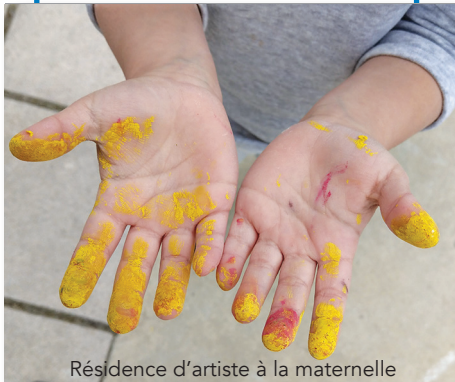
Résidence d'artiste à la maternelle