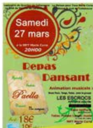
p.7 Les animations sur le quartier