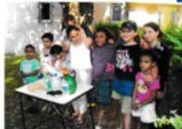
P.6 Les enfants de la Fontaine aux Moines