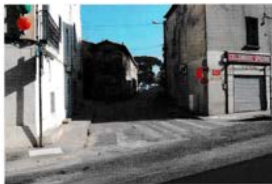
Le débouché trop étroit entre l'avenue des Moulins et l'avenue de Lodève