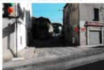
P.4 Plan local de déplacement