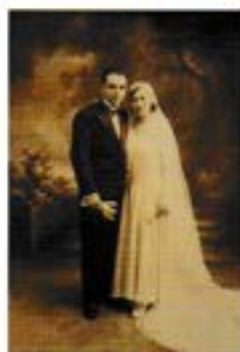
P.5 Portrait d'une centenaire à Celleneuve