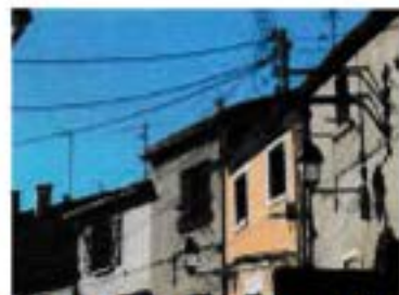
P.2 et 3 Balade dans Celleneuve