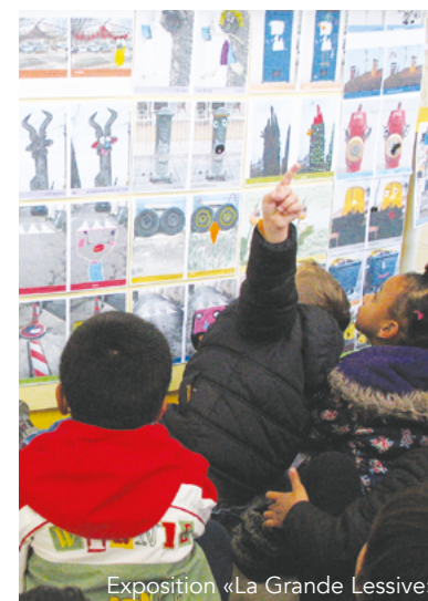
Exposition «La Grande Lessive»

Sur la page "Sortir à Celleneuve" de notre site internet : Les animations proposées dans le quartier tout au long de l'année.