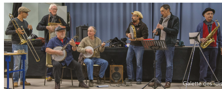
Galette des rois