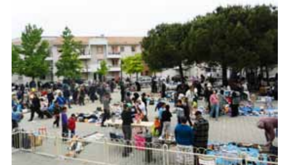
Vide grenier du 8 mai