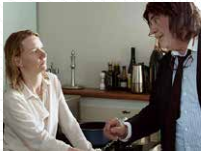
Prix de la Critique internationale / Cannes 2016