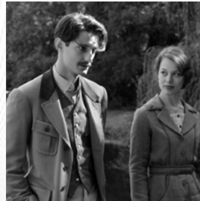
Prix Marcello Mastroianni du meilleur jeune espoir pour Paula Beer / Cannes 2016