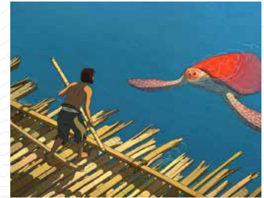
Un Certain Regard - Prix Spécial du Jury / Cannes 2016

De Michael Dudok de Wit France / Belgique / Japon - 2016 - 1h20 - Animation