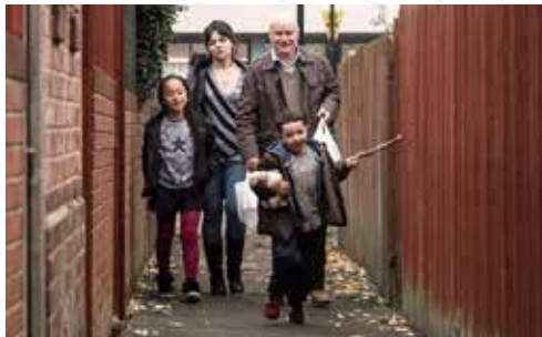
Palme d'Or (Prix du Jury oecuménique, mention spéciale) / Cannes 2016