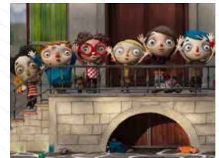
Cristal du long métrage, Prix du public / Festival du film d'animation d'Annecy 2016

De Claude Barras Suisse / France - 2016 - 1h06 - Animation