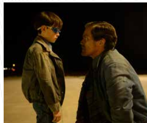
7 nominations / Festival de Berlin 2016