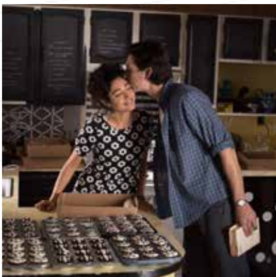
Sélection officielle / Cannes 2016