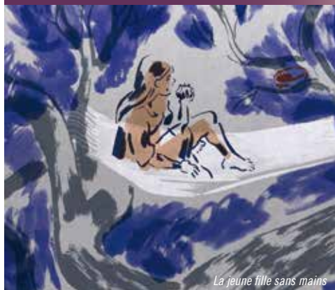
La jeune fille sans mains