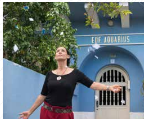
Prix du jury, Grand prix, Prix de la mise en scène / Cannes 2016