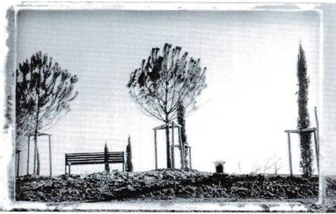
Parc Edouard André