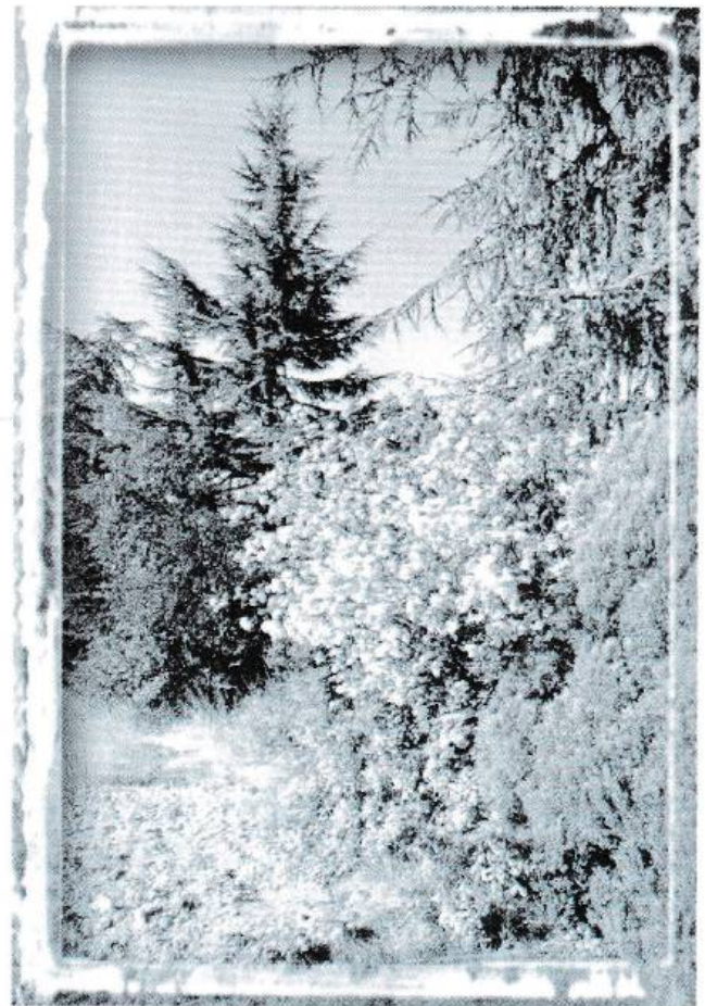
ancien terrain de la CRAM

En séance du Conseil Municipal du 20.02.2000 a été retenu, aussi, l'aménagement de la place d'entrée de la Conciergerie du domaine Bonnier de la Mosson, située avenue de Lodève face au marché aux puces.