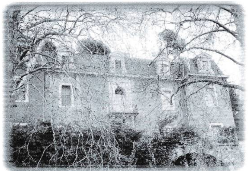
Château de Bionne

Alors que la bougie était devenue toute petite nous avons trouvé une sortie. Une fois à l'air libre nous avons promis de ne plus recommencer. Il fallait être fou pour faire cela. Mais plus de doutes, les souterrains du château de la Mosson existent bien. ■