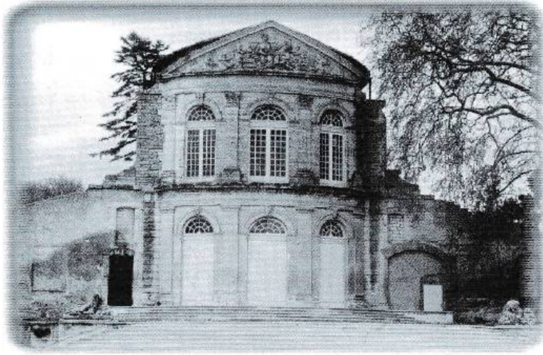
Château de la Mosson

L'origine carolingienne du village créé sous l'empereur Charlemagne a doté Celleneuve de quelques curiosités historiques, par exemple les souterrains bâtis au tout début du Moyen - Age.