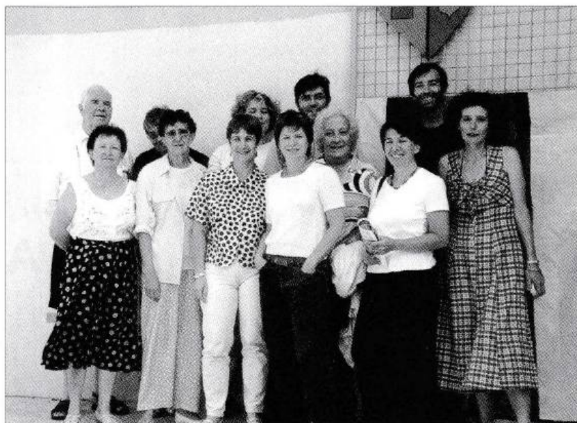
Les membres du Comité de Quartier