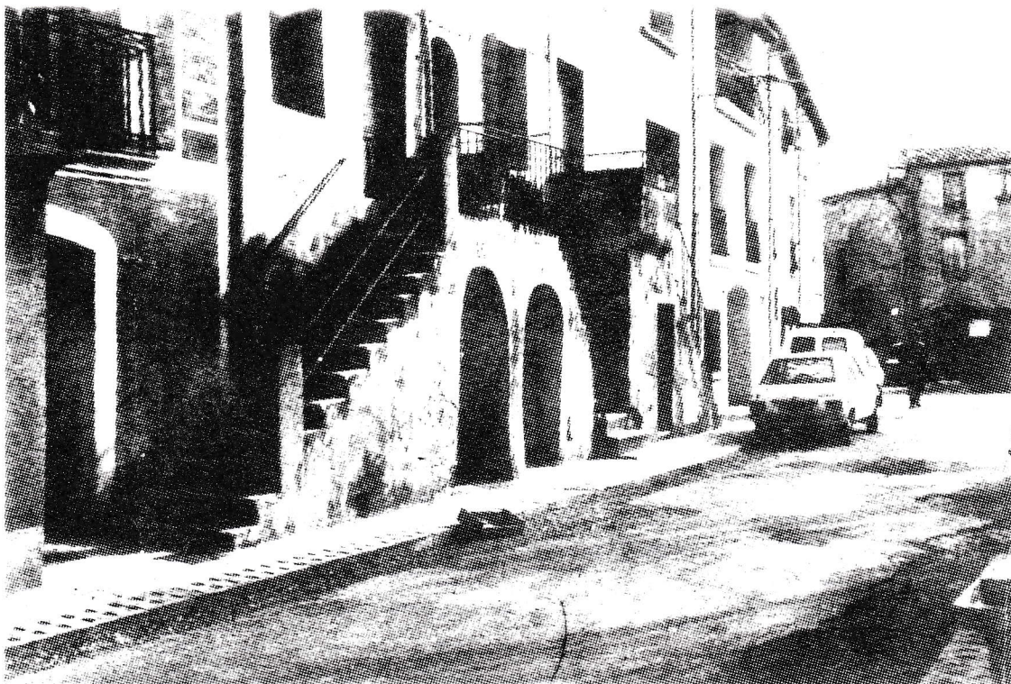
Un escalier typique dans les rues de CELLENEUVE .